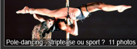
Pole-dancing : striptease ou sport ? 11 photos